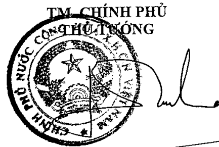
Nguyễn Tấn Dũng